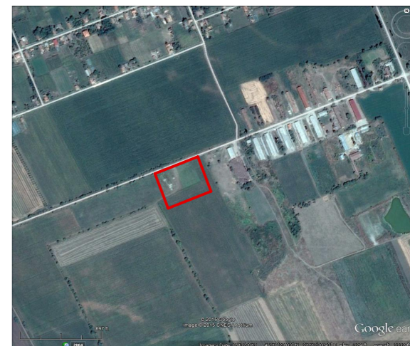
PLAN INCADRARE IN ZONA F.S.